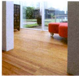
Naturnahe Farben und natürliche Bestandteile: der Bambus-Bodenbelag Unibamboo von Moso.

Der Bambus-Bodenbelag Unibamboo von Moso besteht aus einer zwei Millimeter starken Bambusdeckschicht, die auf eine Latex-Kaschierung aufgebracht wird. Sie wirkt nicht nur als Trägermaterial, sondern gleichzeitig als Schalldämmung. Die Deckschicht besteht aus einzeln aneinander gefügten, 15 Millimeter schmalen Bambuslamellen, die ein aufwändiges Trocknungsverfahren durchlaufen haben. Damit soll eine hohe Stabilität gewährleistet werden. Die Oberfläche ist mit einem wasserbasierten Holzschutzsystem behandelt. Diese sehr matte Veredlung betont das Erscheinungsbild des Bambus. Unibamboo lässt sich sowohl in der Länge als auch in der Breite flexibel zuschneiden sowie zeitsparend