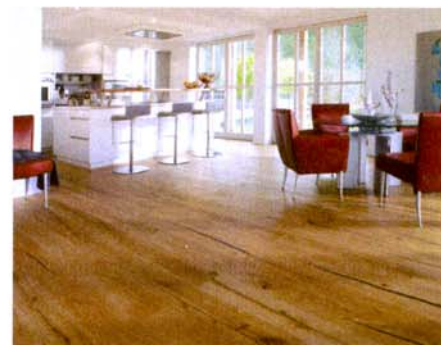
Die neue Landhausdielen Eiche Arizona.

Neue Oberflächen, neue Verbindungssysteme und neue Formate: die Haro-Sortimente wurden dieses Jahr umfangreich erweitert. Die neue Verbindung heißt Top Connect: Längsseitig einwinkeln und stirnseitig mit einem leichten Druck auf die Fläche verriegeln, so verlegt sich das neue Druckknopfsystem von Haro. Mit der Naturöl-Oberfläche „naturaLin“ zieht eine neue Natürlichkeit in das Sortiment ein. Außerdem ergänzt der Parkettspezialist sein Landhausdielensortiment um zehn neue Dielen mit rustikalen, ursprünglichen und trendig weißen Optiken. Ebenfalls erweiterte der Hersteller sein Sortiment an 2-Schicht-Stäben und bei den Laminatböden bietet er neue Dekore. Die Designfliese Celenio glänzt mit größerem Format und