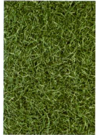
Gras mal anders – als Foto auf dem Boden bringt es lebhaftes Frische ins Objekt.

Mit der Accent Focus genannten Bodenbelags-Kollektion erschließt Tarkett die Fotografie für den Boden. Beruhigend, subtil und spannend zugleich wirkt darin die Kombination aus Farbe und Foto. Dabei untergliedert sich die Auswahl der Bodenbelags-Lösungen in drei Teile, die nach fotografischen Stilrichtungen benannt sind: Natural, Black & White und Synthetic. Wie der Name nahe legt, bietet Natural vertraute Interpretationen der Natur. Grünes Gras und blaues Wasser fügen sich in das vertraute Schema der Realität. Black & White greift die Subtilität der klassischen Fotografie auf. Das Synthetic-Sortiment stellt spannende neue Verbindungen zwischen Motiven und Farben her und kann bei Bestellungen ab 500 Quadratmetern in jeder beliebigen Farbe individuell gefertigt werden. Natural und Black & White sind jeweils Lagerware.