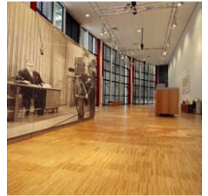
Moso® Parkett Hochkant Industrieboden Gedämpft