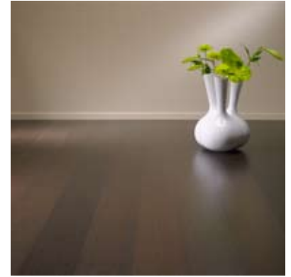
Moso® Parkett Hochkantlamelle Schwarz