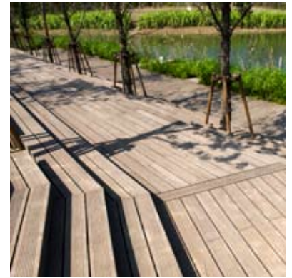
Bamboo X-Treme™ Terrassendielen