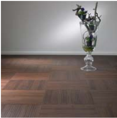
Moso® Fliese Colonial