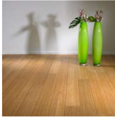
Moso® Parkett Hochkantlamelle Gedämpft