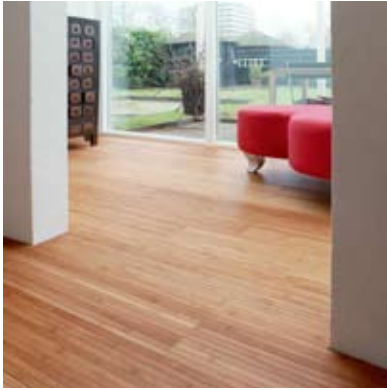
Unibamboo™ Diele Gedämpft