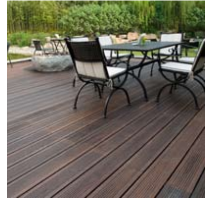
Bamboo X-Treme™ Terrassendielen