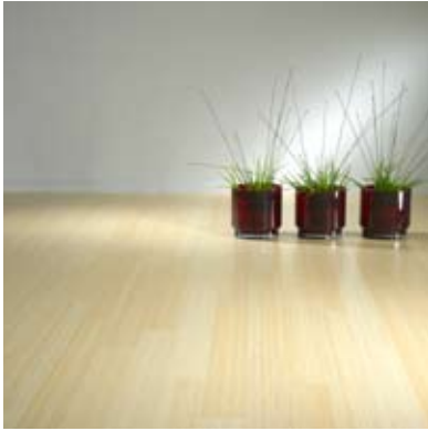
Moso® Parkett Hochkantlamelle Naturhell