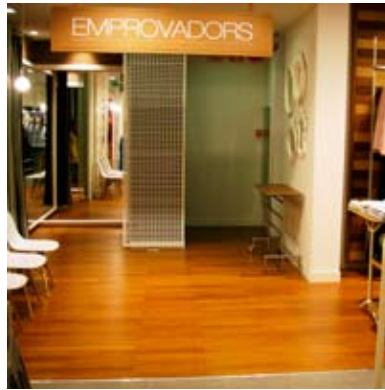
Moso® Parkett Density Gedämpft