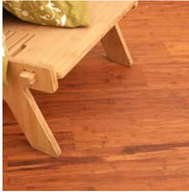
Topbamboo™ Density Gedämpft