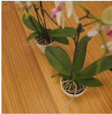
Topbamboo™ Hochkantlamelle Gedämpft