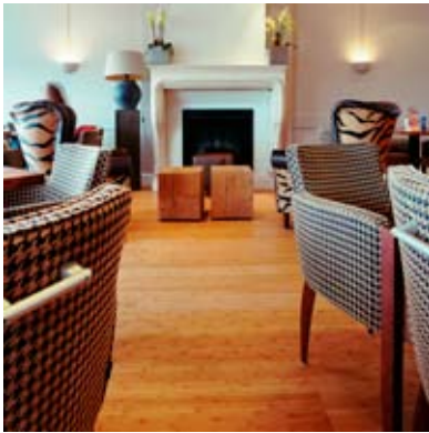
Moso® Parkett Breitlamelle Gedämpft